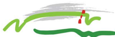
TABLE MOUNTAIN AERIAL CABLEWAY

Sweefspoor in bedryf indien die weer dit toelaat.