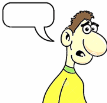
Skets 1: manwatstaar