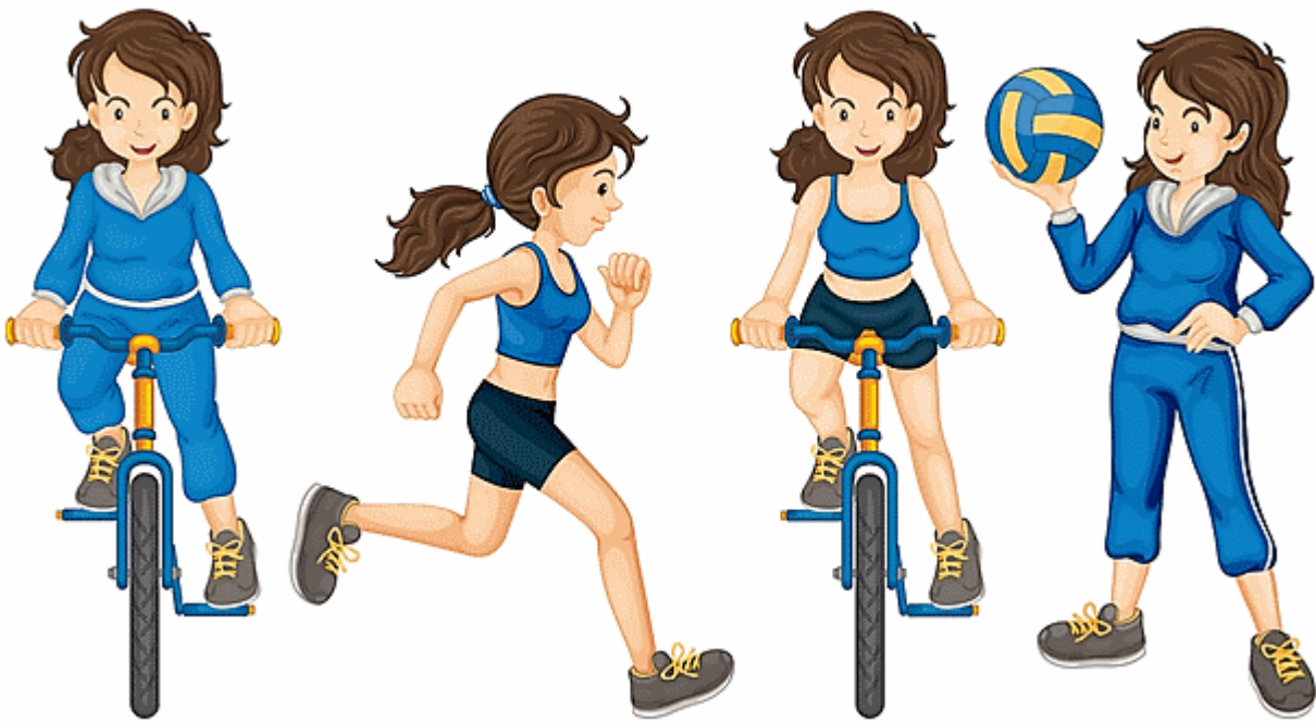
Skets 4: aktief