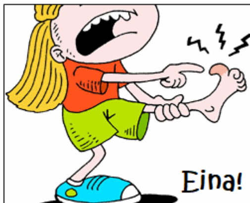
Skets 2: tussenw